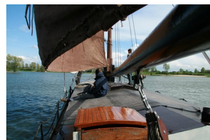
Clasina onder zeil