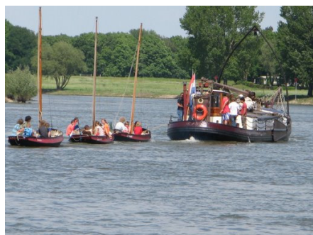
De vletten worden gesleept (Admi-kamp)